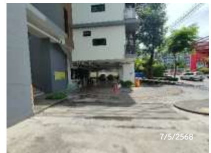
จุดรวมพล