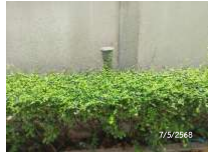
ท่อเติมอากาศระบบบำบัดน้ำเสีย