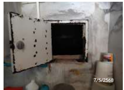
ถังเก็บน้ำสระว่ายน้ำ