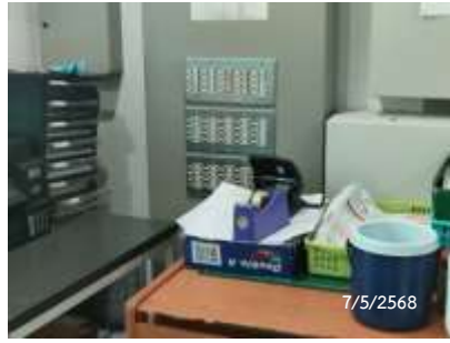
สวิตช์ไฟแยกแต่ละส่วนพื้นที่ส่วนกลาง