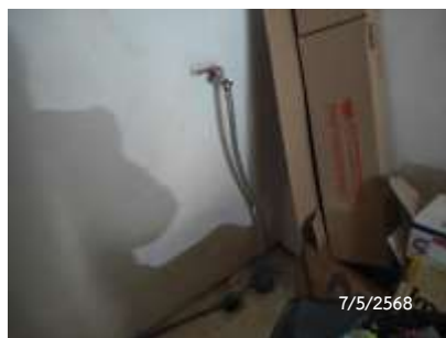
ก๊อกน้ำและท่อระบายน้ำ