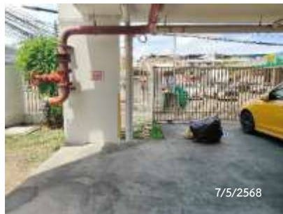
จุดพักขยะรวมของโครงการ