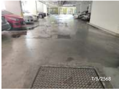
ระบบบำบัดน้ำเสีย