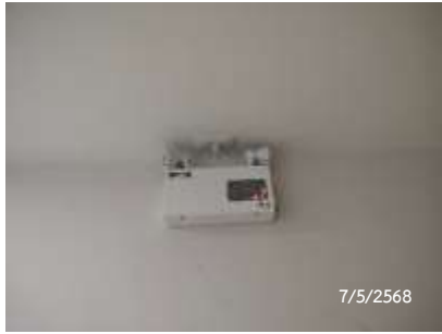
ไฟสำรองฉุกเฉิน