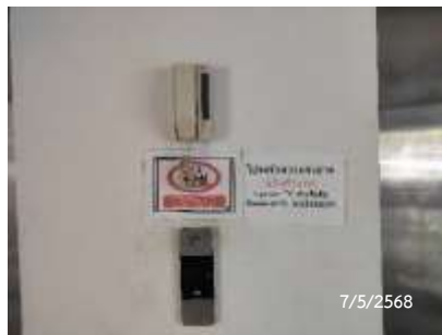
โทรศัพท์ฉุกเฉิน