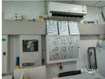
Fire Alarm Control Panel