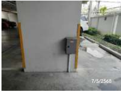
Ground Test Box