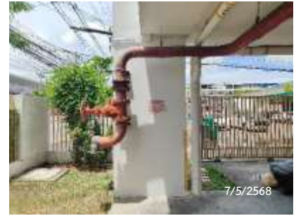
หัวรับน้ำดับเพลิง