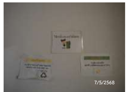
ป้ายรณรงค์การคัดแยกมูลฝอย