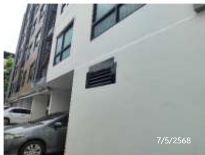
ช่องระบายอากาศ