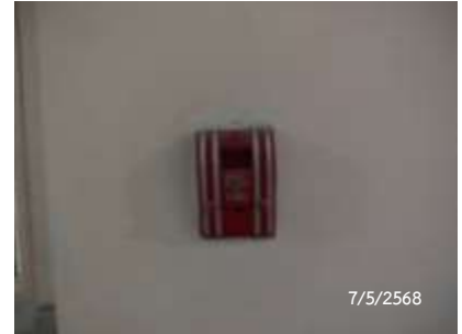
Fire Alarm Manual Station