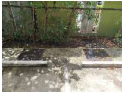
บ่อหนองน้ำ