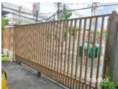
จุดจอดรถเก็บขนมูลฝอย