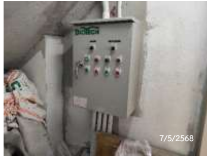
ตู้ควบคุมระบบบำบัดน้ำเสีย