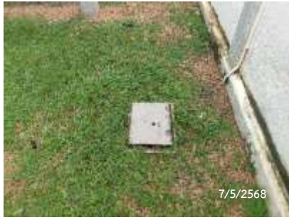
บ่อพักน้ำรอบโครงการ