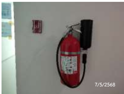
ถังดับเพลิง