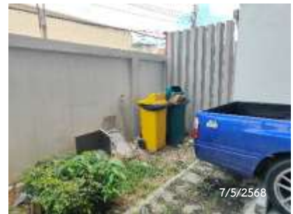
ถังขยะบริเวณพื้นที่ส่วนกลาง