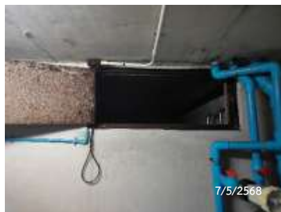
ถังเก็บน้ำชั้นใต้ดิน