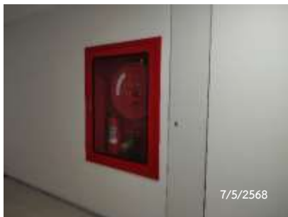
Fire Hose Cabinet