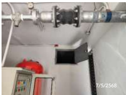
ถังเก็บน้ำชั้นดาดฟ้า