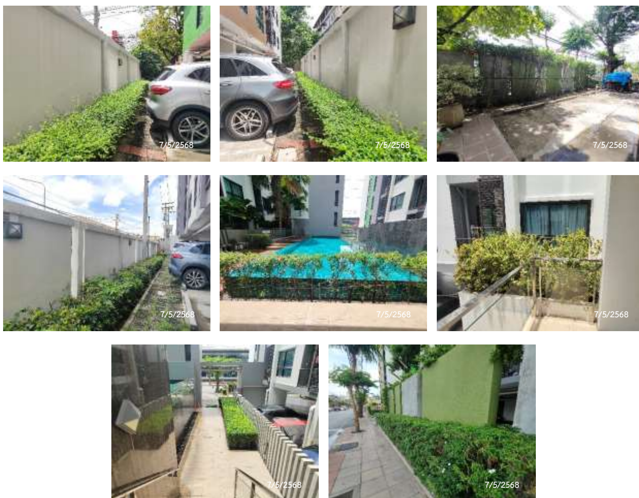
ภาพที่ 2.1-2 พื้นที่สีเขียวของโครงการ