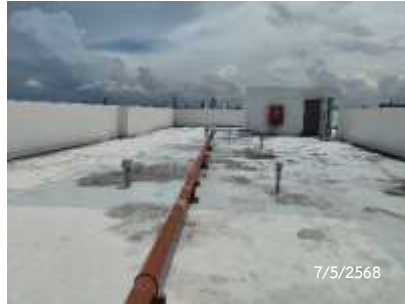
ท่อระบายอากาศ