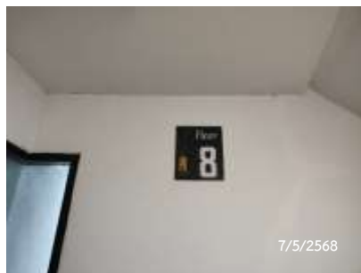
ป้ายบอกเลขชั้น