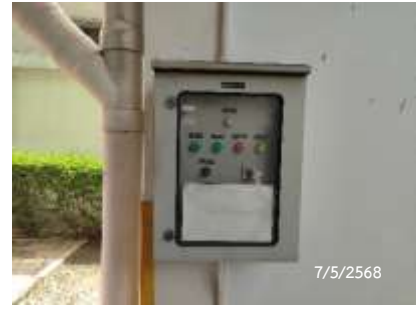
ตู้ควบคุมปั๊มบ่อหนองน้ำ