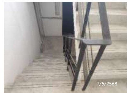
บันไดหนีไฟ