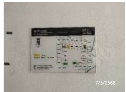
ผังแสดงเส้นทางหนีไฟ