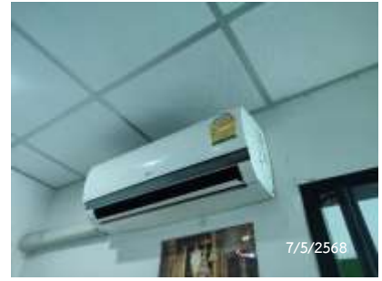
เครื่องปรับอากาศ