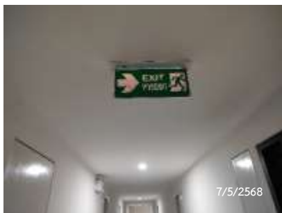
ป้ายบอกทางหนีไฟ