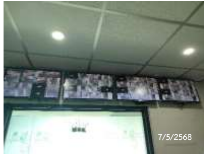
ห้องควบคุม CCTV