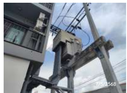
หม้อแปลงไฟฟ้า