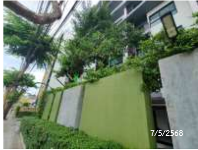
ไฟส่องสว่างรอบโครงการ